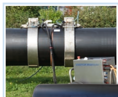
Chipmærkede muffer Svejsmaskinen indstilles korrekt på basis af de individuelle produkt- og svejsedata, som er lagret på muffens RFID-tag.

Svejsmufferne er unikke, fordi de er udstyret med en chip, den såkaldte RFID-tag, der bedst kan sammenlignes med en lille harddisk, hvorpå produkt- og produktionsdata er lagret for netop den muffe. Det betyder, at svejsmaskinen - blot ved at lade PDA'en scanne data fra chippen - automatisk indstilles korrekt. Herved undgås fejl i forbindelse med betjening. Alle produktionsdata opsamles og lagres automatisk til brug for den samlede dokumentation.